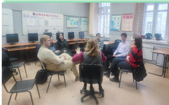
ГБПОУ «Иркутский областной музыкальный колледж им. Ф. Шопена»