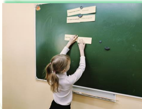
ГОКУ ИО «СКШИ для обучающихся с нарушениями зрения № 8 г. Иркутска»