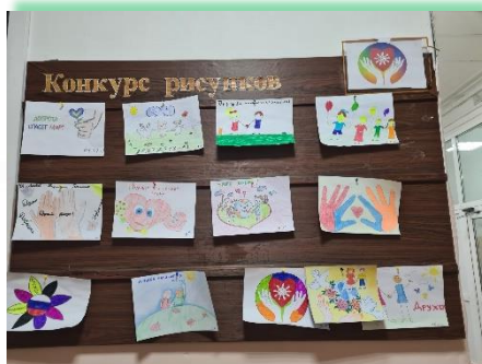
ГОКУ ИО «СКШИ для обучающихся с нарушениями слуха г. Черемхово»