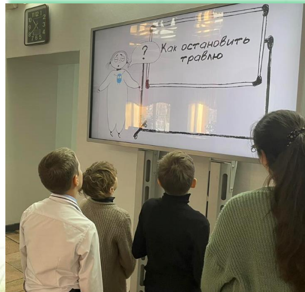
ФГКОУ «Средняя общеобразовательная школа № 178»