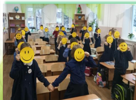
Муниципальное образование «Слюдянский район»