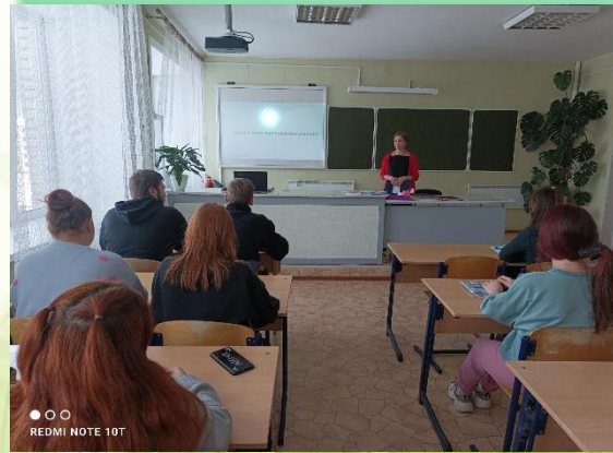
ГБОП ИО «Киренский профессионально-педагогический колледж»