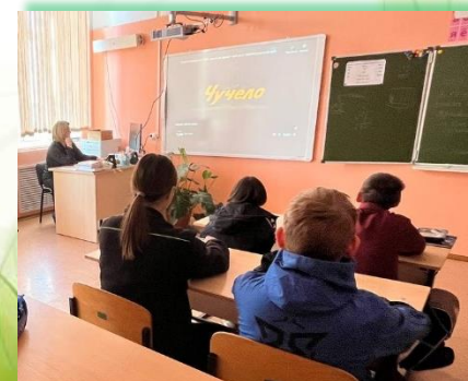
ГОКУ ИО «Специальная (коррекционная) школа № 3 г. Иркутска»