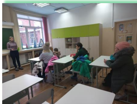
ГОКУ ИО «СКШ № 14 г. Иркутска»