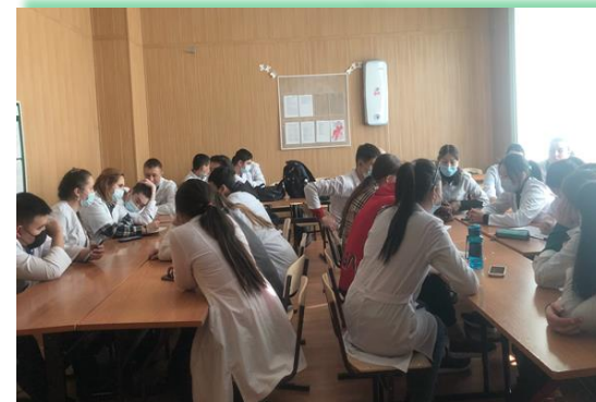
ОГБПОУ «Усть-Ордынский медицинский колледж им. Шобогорова М.Ш.»