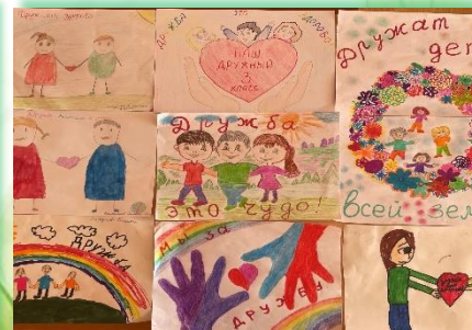
Муниципальное образование «Осинский район»