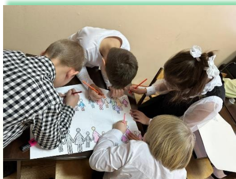
ГОКУ СКШ г. Усть-Илимска