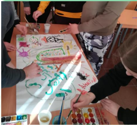
ГАПОУ ИО «Иркутский техникум индустрии питания»