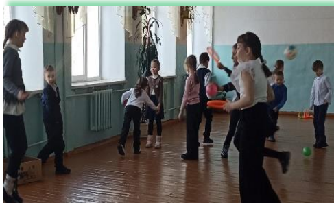
Чунское районное муниципальное образование