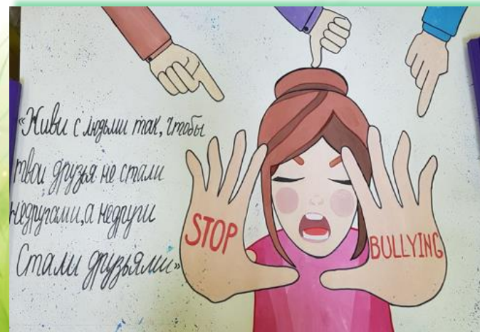
ОГБПОУ «Черемховский медицинский техникум им. Турешевой А.А.»