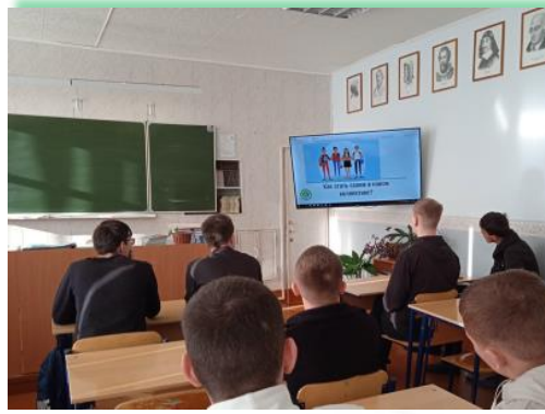
ГАПОУ ИО «Братский индустриально-металлургический техникум»