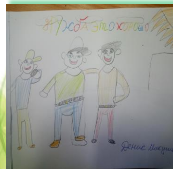
ГОКУ ИО «Специальная (коррекционная) школа № 11 г. Иркутска»