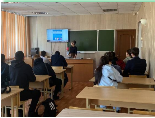
ГАПОУ ИО «Ангарский техникум строительных технологий»