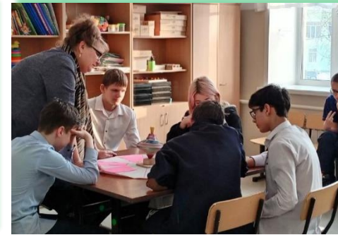
ГОКУ ИО «СКШИ № 19 г. Тайшета»