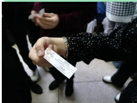
Муниципальное образование город Усть-Илимск