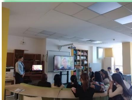
Муниципальное образование - «город Тулун»