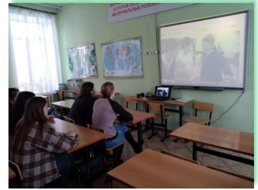
ГАБПОУ ИО «Нижеудинский техникум железнодорожного транспорта»