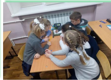
Муниципальное образование «город Свирск»