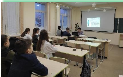
Районное муниципальное образование «Усть- Удинский район»