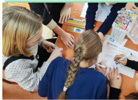
Усольское районное муниципальное образование