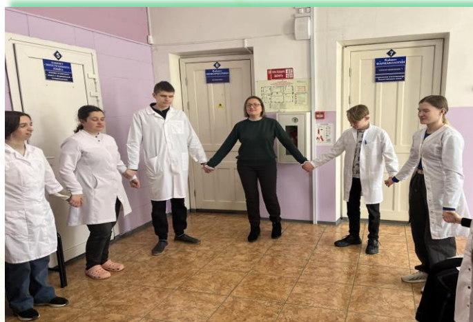
ОГБПОУ «Усольский медицинский техникум»